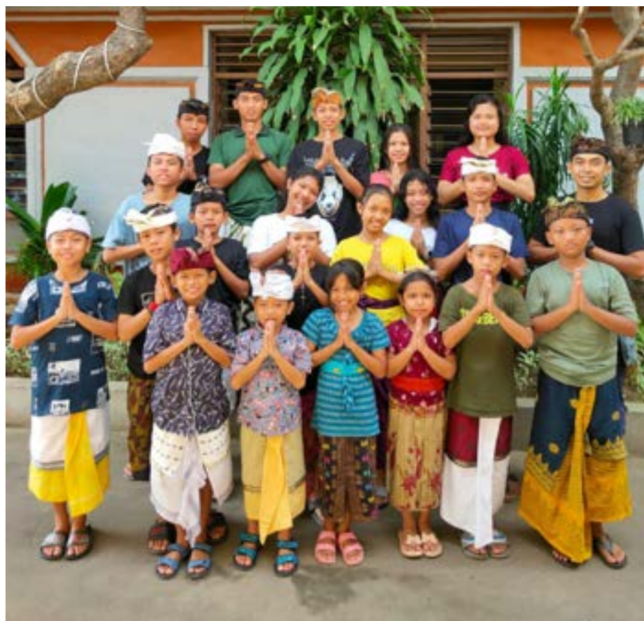
ZORG VOOR WEDUWEN & WEZEN SINGARAJA – BALI