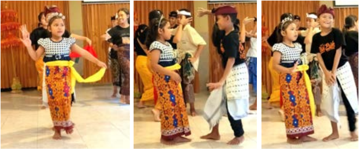
Veel zang en dans, muziek en creativiteit in het Lion King Bali weeshuis.