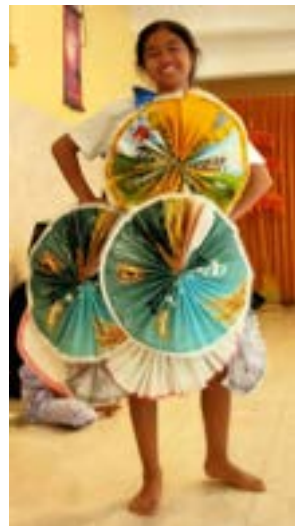
Mode show : gemaakt van afval.